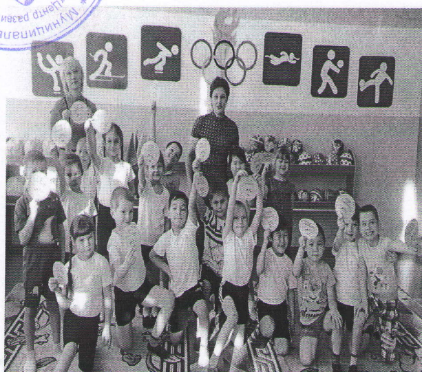
Логопедическая спартакиада: «Ловкий грамотей!»